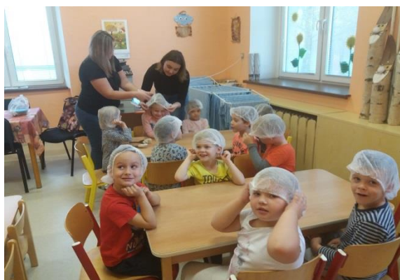
Foto z pilotáže v MŠ Šilheřovice.

Tato aktivita je dílčí a je součástí komplexní aktivity s názvem „Škola otevřená spolupráci s místní komunitou, spolkami a firmami – podpora vzdělávání a výchovy formou praktických ukázek“, tematická oblast Zdravý životní styl s ochutnávkou a přípravou zdravých pochutin ze strany dětí.