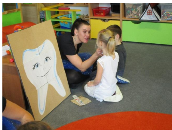
Fotky z pilotáže v MŠ Velké Hoštice.