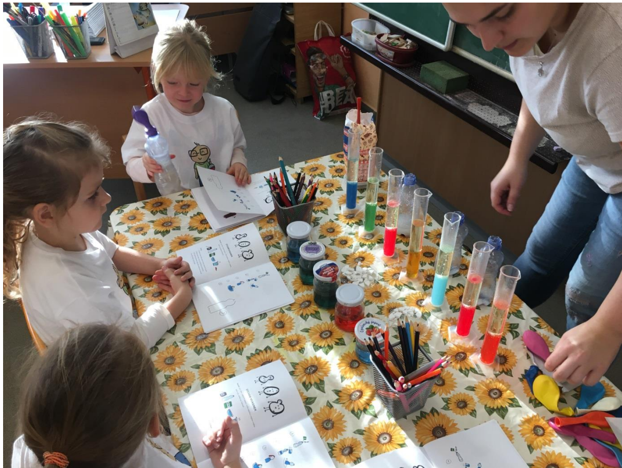
Foto z MŠ Bohuslavice.

Místo realizace: daná mateřská škola Kapacita/Rozsah: 2-3 třídy během dopoledne / 50 min. = 1 třída Poznámka: plně hrazeno z prostředků MAP II