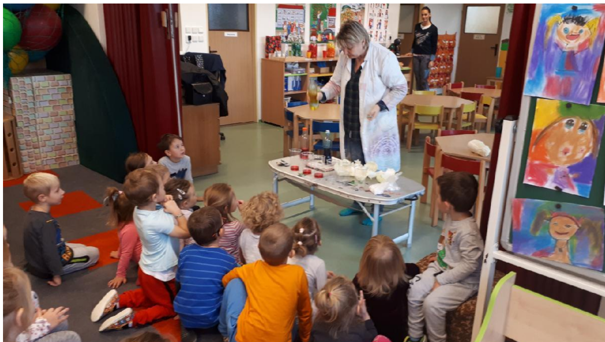
Foto z MŠ Velké Hoštice.

Poznámka: plně hrazeno z prostředků MAP II