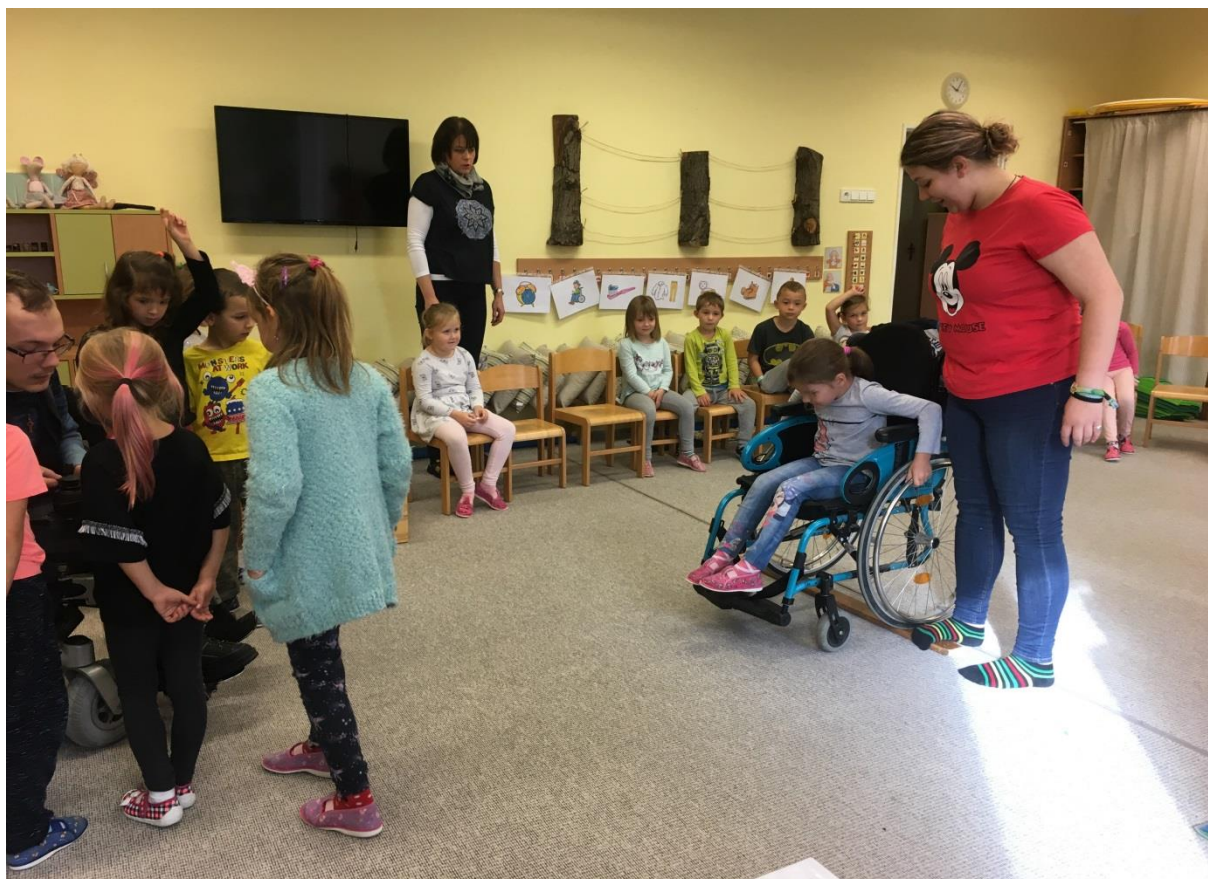
Foto z pilotáže v MŠ Petra z Kravař.