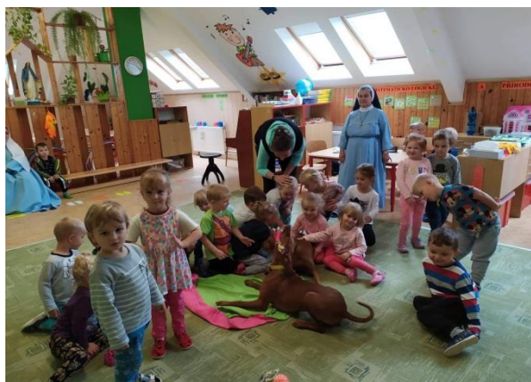
Foto z Církevní MŠ Ludgeřovice.

Tato aktivita je dílčí a je součástí komplexní aktivity s názvem „Škola otevřená spolupráci s místní komunitou, spolků a firmami – podpora vzdělávání a výchovy formou praktických ukázek“, tematická oblast Zdraví a zdravý životní styl dětí .