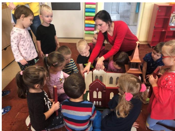
Foto z MŠ Oldřišov.

Tato aktivita je dílčí a je součástí komplexní aktivity s názvem „Vlastivědný kufřík“.