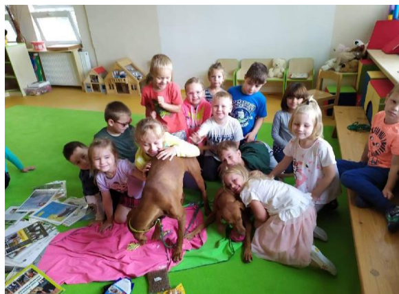
Foto z MŠ Hlučín, Severní.