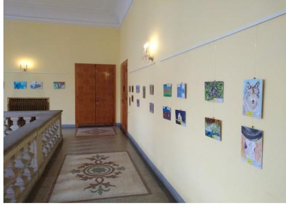
Foto ze zámku v Kravařích.