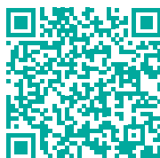
Dokumenty a metodické pokyny