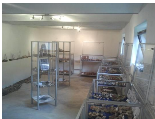
Bolatice - Rozšíření expozice skanzenu v Bolaticích