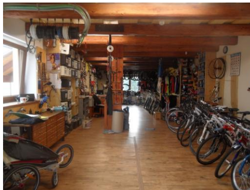
Petr Novák - Sportovní vercajk pro všechny Prajzáky