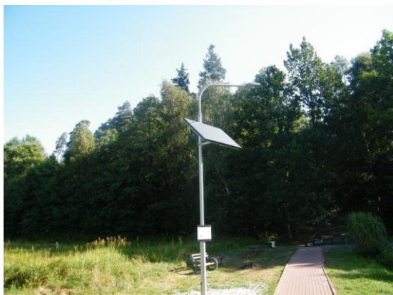
Bělá - Abychom se lépe viděli, nebáli se vlka nic