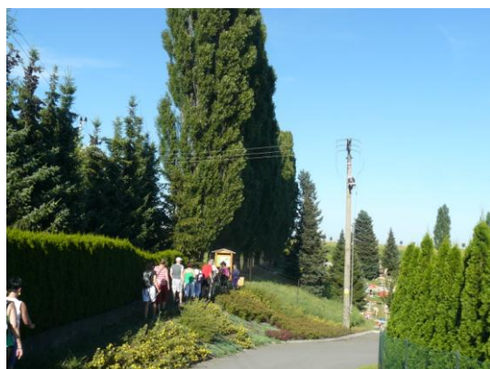
Bolatice - Suchou nohou za poznáním Bolatických poldrů