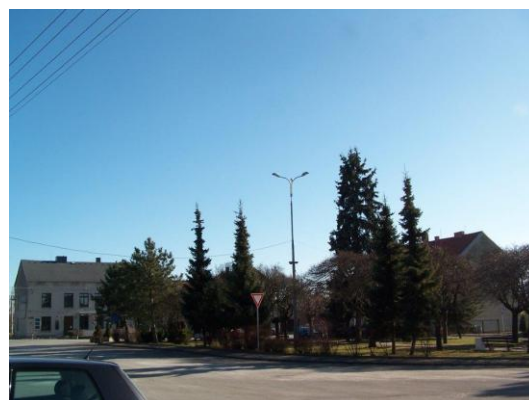
Sudice - Sportovat a aktivně žít jde i po setmění