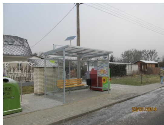
Kravaře - Aby se nám tu dobře čekalo