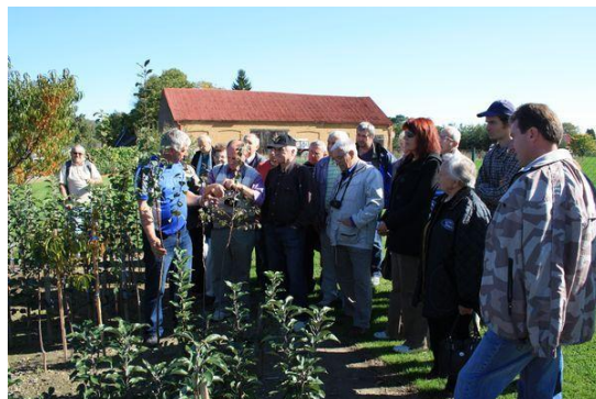
Sdružení obcí Hlučínska - Ovocnářské vzdělávání na Hlučínsku