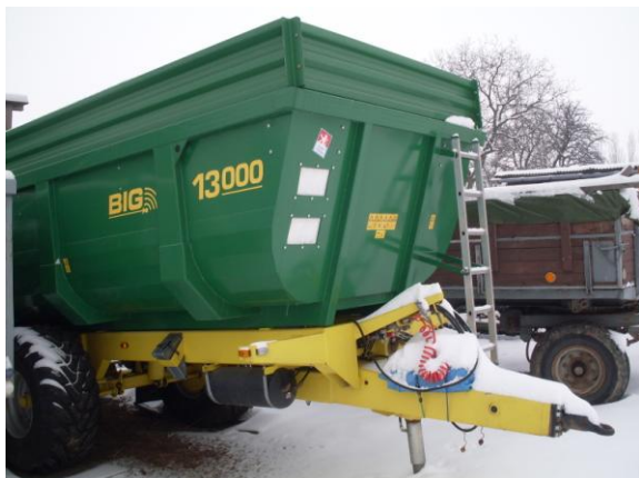
Emil Kašný - Rychle naložíme, snadno a lehce vyklopíme