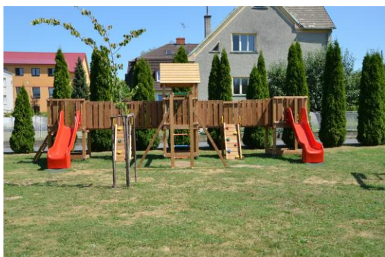
Závada - ROBKA BER DŽECKA A POČ NA RELAX KU ŠPILPLACU