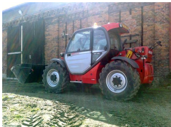
Alfons Laňka - Včil vám to naložím