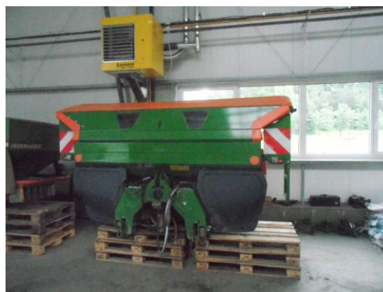
ZD Hněvošice - Šetrné a efektivní hnojení