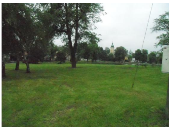
Oldřišov - Do parku na špacír i na odpust