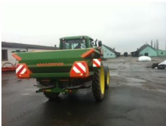
ODV Oldřišov - Hnojení na evropské úrovni