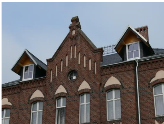
ŘKF Ludgeřovice - Generální oprava střechy farní budovy Ludgeřovice